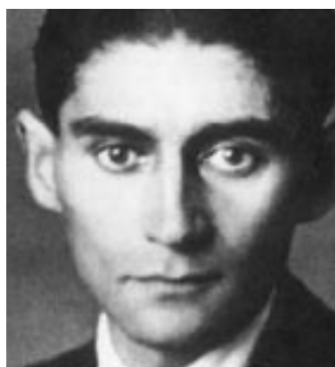
בכיוון השעון: הוגו ברגמן (ימני עליון), רודולף שטיינר, פרנץ קפקא ואלברט איינשטיין

הגם שכאן יש לי שוב ושוב סימני שאלה, כיוון ששטיינר, אם היה מי שחושבים שהיה, היה עמוק מכדי שיוכל להיות דוגמה אישית לאדם שכמוני [...] עם שטיינר לא היה אפשר להתווכח. בלתי-אפשרי היה לתאר מצב שבו שטיינר אומר: אתה צודק, אני טעיתי"