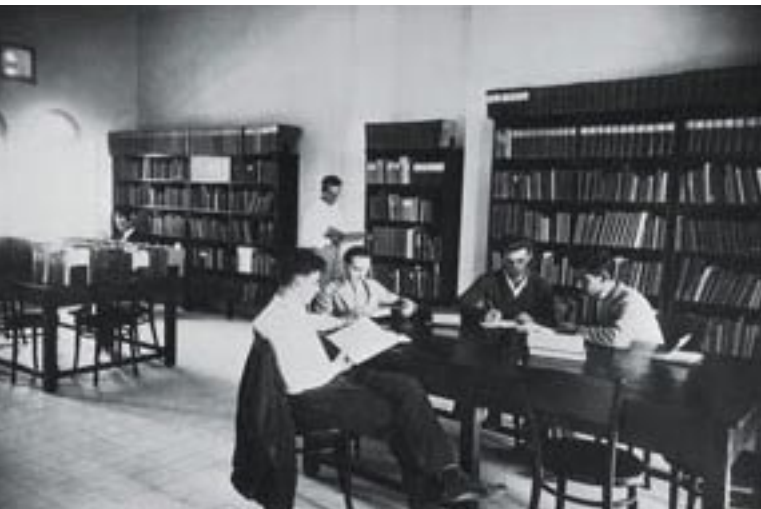
האוניברסיטה העברית בירושלים 1935

למיניהם עלולים, מסיבות ובנסיבות של ביוגרפיה (וגורל!) שלא לתקשר זה עם זה באורח מספיק. חוסר התקשורת בין רכיבי הנפש יכול להיות הגורם לבעייתיות בחיבור הפנימי של האדם עם עצמו וכפועל יוצא מכך, גם לבעיית התקשורת הבין-אישית. הבנה זו של התנהלות חיי-הנפש מבוססת על התבוננות מפורטת בסממני התחום הנקרא "נפש". שטיינר (לדוגמה בספרו "גוף, נפש, רוח") מתאר לעומת-זאת גם את הארכיטקטורה המבנית של אותה הנפש ומציג את פוטנציאל ההתפתחות שלה, בממד האישי ובממד הכלל-אנושי. ההתפתחות – כעיקרון הפועל במישור האישי והכלל-אנושי – היא האתגר העיקרי ששטיינר מעמיד לפני קוראיו, אתגר שאפשר לממש במישור האישי, ורק מתוך חירות פנימית מוחלטת.