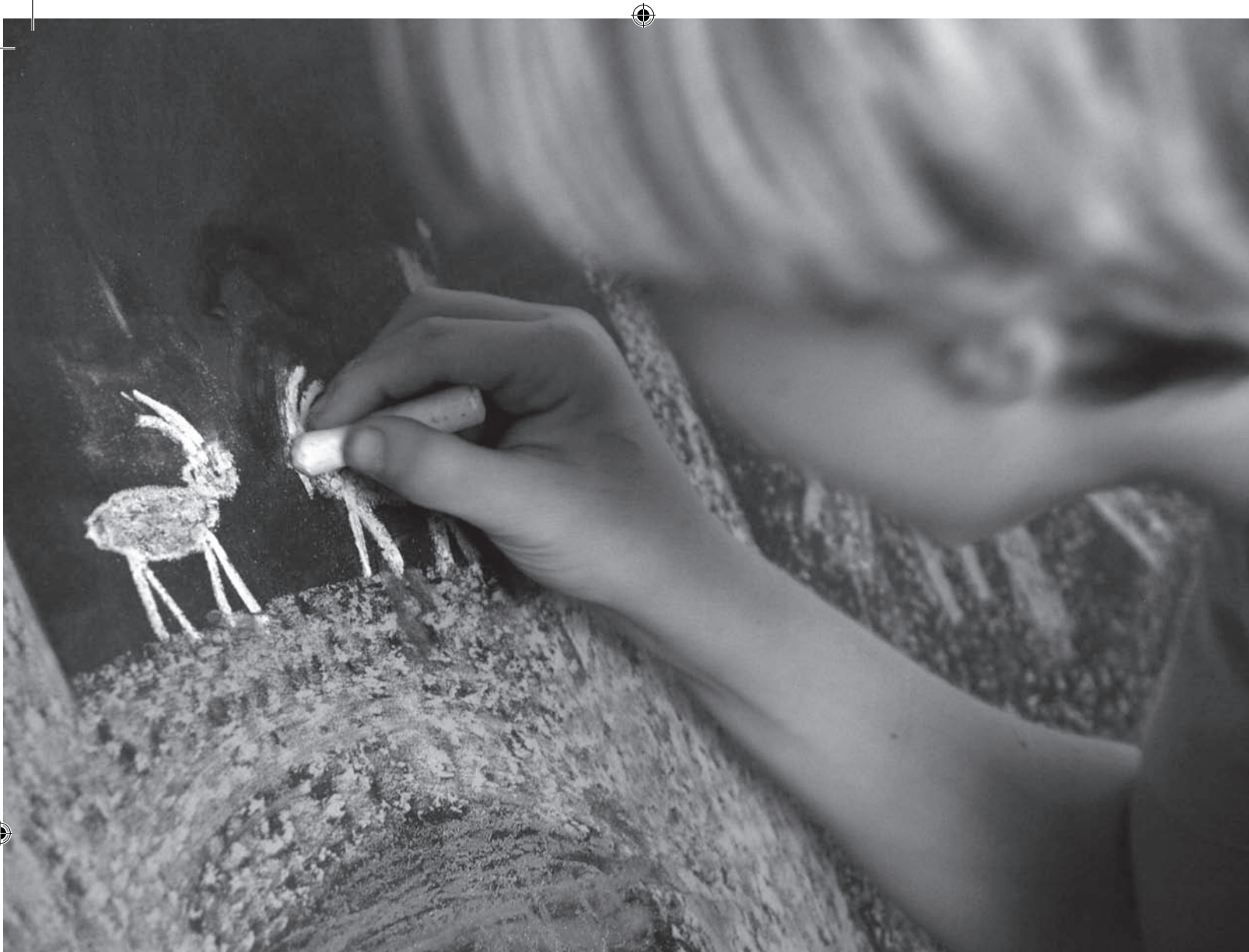
תלמיד כיתה ב'. לילדים יש מחשבות נפלאות שהם חולקים עם חברהם, בעיקר כשמדובר בחיות

את תלמיד כיתה ב' לפרפר שבקע זה עתה מהגולם ומחכה שכנפיו יתחזקו והוא יוכל לעוף. הוא עומד על סף התעוררות של כוחות חדשים, המצמיחים ומנביטים בו עולם רגשי סובייקטיבי. פליאה, חמלה, הנאה, ועצב.