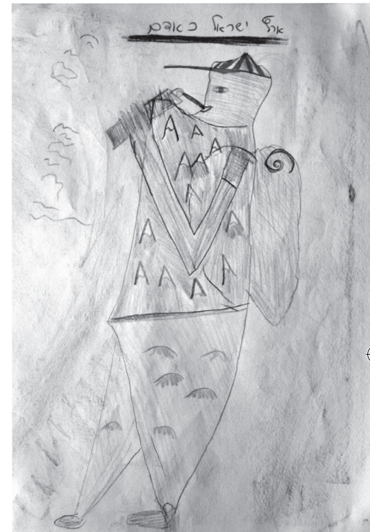
ציור ממחברת מתלמידי כיתה ה' בבית-הספר אדם, ירושלים

ירושלמים מתבוננים על ארץ-ישראל כירושלמים, משפט המפתח שליווה אותנו בלימוד על ירושלים בכיתה ד', היה הפסוק של חז"ל: "ארץ-ישראל יושבת באמצעיתו של עולם, וירושלים באמצע ארץ-ישראל, ובית המקדש באמצע ירושלים, וההיכל באמצע בית המקדש, והארון באמצע ההיכל, ואבן השתייה לפני הארון – שממנה הושתת העולם." (1) מתוך פסוק זה פיתחנו והרחבנו את לימודינו על ירושלים, ואכן, לילדי כיתה ד' לא היה קשה להתחבר לתכנים האלה. כעת, בכיתה ה', נזכרנו במשפט הזה והתחלנו את הלימוד בשאלה – איזה כינוי נוסף יש לארץ-ישראל? ובמהרה הגיעה התשובה: "ארץ הקודש". גם על השאלה – מדוע "ארץ הקודש"? ידעו הילדים לענות: