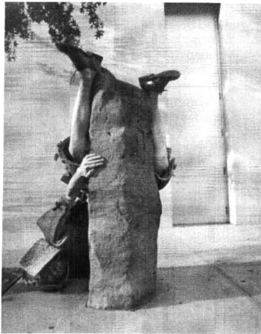
Bruce High Quality Foundation Joseph Beuys