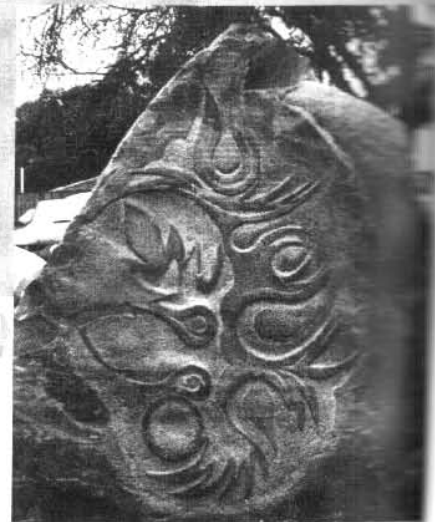
השקטורפוזזה של הצמח. אוסטרליה 2003