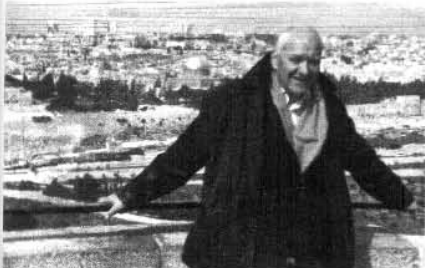
מת'יסן על רקע העיר העתיקה בירושלים

המעוניינים לקחת חלק בהקמת פארק השלום בירושלים יפנו לנועם בטלפון 052-3482289 או בדוא"ל noamonline@gmail.com