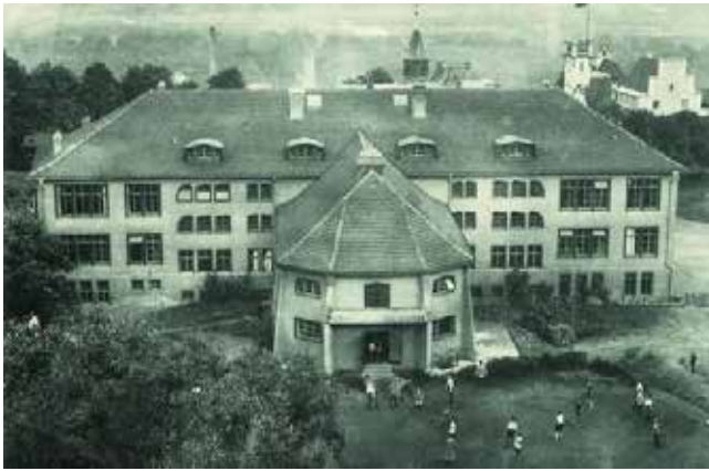
מפעל הסיגריות ולדורף