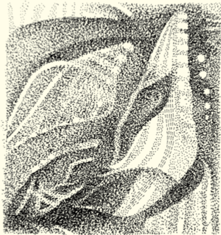
דנה לין, קונפיה ומלפפון ים, 2015, 5x5 ס"מ, עט על נייר

חוק ההפנמה הוא אחד החוקים הקארמטיים שאיתם אנו יכולים לעבוד. לפי חוק זה, מציאות שנוצרת על-ידי בחירות של האני באינקרנציה אחת, מעצבת את הגוף האסטרלי באינקרנציה הבאה, אלה בתורם מעצבים את הגוף האתרי באינקרנציה שאחריה, וזה מעצב בגלגול הבא את הגוף הפיזי. ניקח לדוגמה את אותה אישה שיכלה להתחקות אחרי חייה כמשגיח הנוגש באכזריות בעבדים. השנאה באותה אינקרנציה הביאה לחיים של בדידות באינקרנציה שאחריה, ובאינקרנציה שלישית לחיים כעל פיגור שכלי. דוגמה אחרת: פסיכולוגית אחת תיארה לפני את חייה הקודמים ככומר פרוטסטנטי. יכולנו